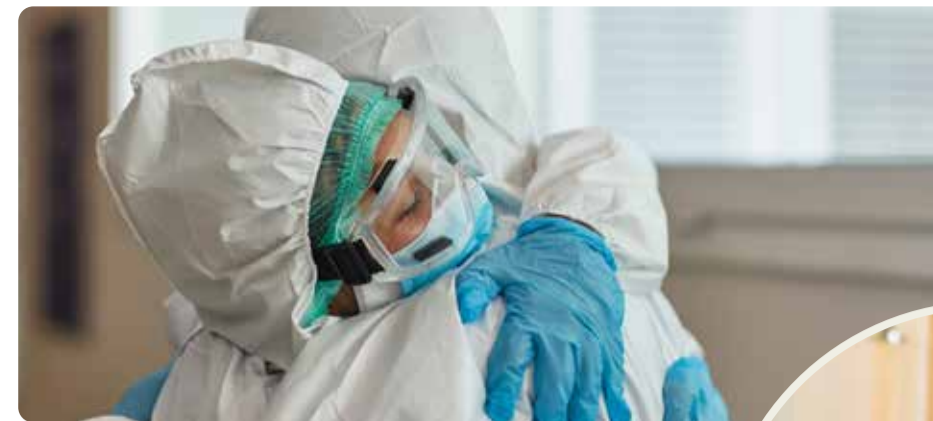
Pandemin visade på brister i välfärden. Vänsterpartiet vill bygga samhället starkt igen.

gav är borta. Skolorna drivs för att tjäna pengar istället för att ge utbildning. Vården har man privatiserat, sålt ut och underfinansierat, så att mindre och mindre pengar finns till läkare och undersköterskor. Skulle vi bli sjuka eller arbetslösa kan vi inte vara säkra på att ersättningen går att leva på. Behöver vi en plats på BB kan vi inte vara säkra på att det finns en ledig, behöver vi en ambulans kan vi inte vara säkra på att den kommer i tid. Vi kan inte lita på att skolan har resurser nog att ta hand om våra barn, unga vuxna kan inte flytta hemifrån för att det är sådan bostadsbrist. Det är inte någon naturlag